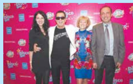
Своим отношением к даче, саду, огороду и здоровому образу жизни делились Александр Буинов, Вячеслав Добрынин и другие звезды эстрады.