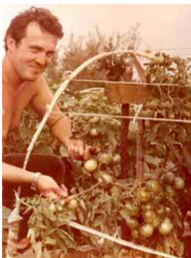
1986 год, бизнес начинался с семян томатов

С этого я начинал и потому абсолютно уверен, что земля может кормить, обеспечивая не просто хлебом, но хлебом с маслом, и даже с икрой.