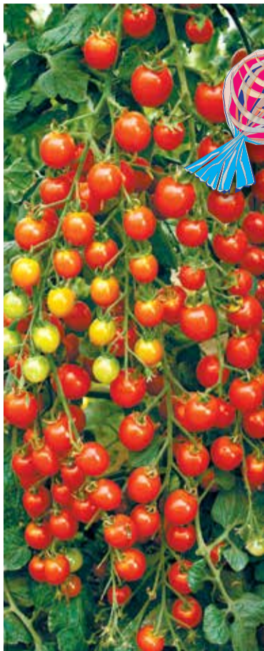
Томаты Волшебный каскад F1 – россыпь вкуснейших черри-томатов

Возможно ли заставить ребенка есть поменьше конфет и побольше овощей? Вопрос отнюдь не риторический. Очень даже возможно: для этого нужно всего-навсего включить в меню чада черри-томаты. И тогда казалось бы несбыточная мечта каждого родителя станет реальностью. От сочных и сладких «конфеток» с грядки детей за уши не оттащишь. Да и взрослых тоже.