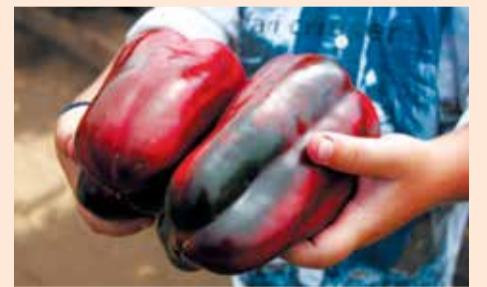
Плоды Маршал Жуков F1 могут достигать массы 300–400 г.

И «маршалы», и «адмиралы», и «генералы» можно выращивать в обыкновенном дачном парнике и в открытом грунте. Все они отличаются повышенной стрессоустойчивостью и болезнестойкостью, особенно к таким болезням, как вертициллезное увядание, вирус табачной мозаики и вирус пятнистого увядания томата. «Полководцы» показали прекрасные результаты и в Подмошкве, и в Архангельске, и в Хабаровске в тех же простых пленочных укрытиях. Все семеро