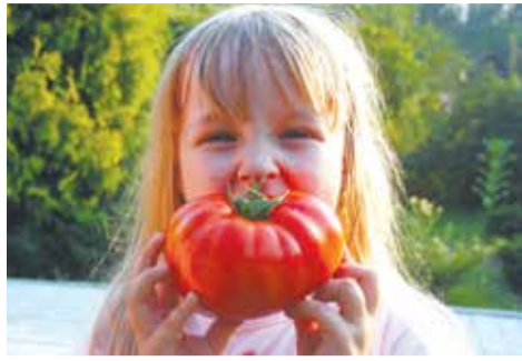
Масса плодов гибрида Александр Великий F1 может достигать 350 г и более! Очень вкусные и сочные плоды, идеальны для свежего употребления.

В регулярном приеме витаминных препаратов пропадет всякий смысл, если ежедневно включать в свое меню свежие овощи. Например, томаты Александр Великий F1 , Владимир Великий F1 и Екатерина Великая F1 , которые получили столь многообещающее название не только благодаря своему внешнему виду и размерам, но также урожайности, качественным и вкусовым характеристикам.