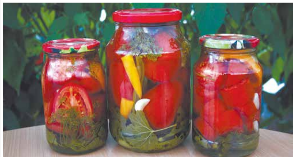
Царские томаты можно консервировать и целиком, и дольками. Плоды сохраняют и целостность, и цвет, и вкус