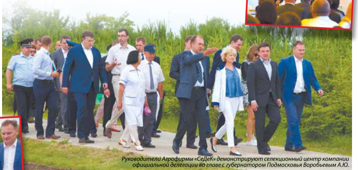
Руководители Агрофирмы «СеДеК» демонстрируют селекционный центр компании официальной делегации во главе с губернатором Подмосковья Воробьевым А.Ю.

Цели проведения Форума обозначил губернатор в начале своего выступления: «Мы собрались для того, чтобы разобраться, задать вопросы, получить ответы, вникнуть, понять, что необходимо сделать, чтобы агробизнес набирал обороты. Мы взяли за серьезное, системное развитие сельского хозяйства. Каждый год дополнительно мы вводим в оборот 50–60 тыс. га земли (в Подмосковье – Прим.) – это хорошая динамика. За следующие 5 лет мы, по сути, исчерпаем лимит пахотных земель, и наша задача будет заключаться в том, чтобы обеспечить