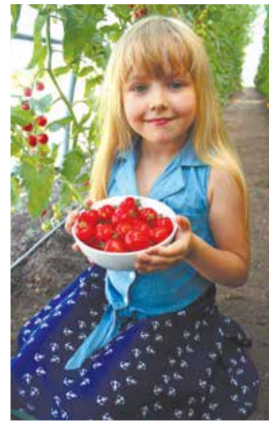
Черри клубничный F1. Дети точно не откажутся попробовать черри-томаты, похожие на аппетитные ягодки

Удивительны на вкус и цвет и новые «карамельки с начинкой». Томат Черри клубничный F1 – очень ранний: алые сердцевидные, похожие на ягоды клубники, плоды поспевают уже на 90–95-й день и одинаково сильно радуют гурманов как в свежем, так и в консервированном виде. Ну а такого окраса, какой имеет Черри со сливками F1 , вы точно никогда не видели. На стадии созревания элегантные