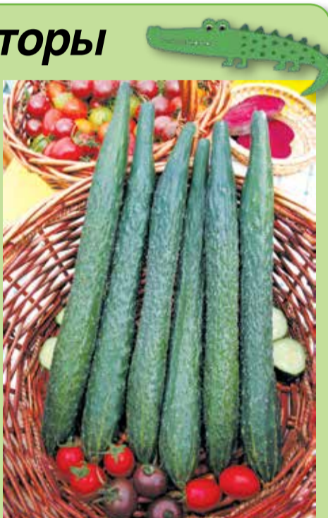
Длина плодов огурцов-аллигаторов может достигать 40 см!

👉 скороспелость (25–30 дней от всходов до сбора). Их можно сажать несколько раз за сезон. Например, на опытном участке Агрофирмы «СеДеК» первый посев проводят в марте, и уже в майские праздники в теплице можно снимать по несколько длинных плодов с растения. Последний посев можно проводить в августе.