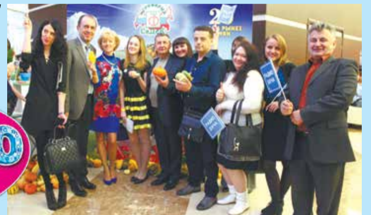
Часть коллектива Агрофирмы «СеДеК» на открытии дачного сезона вместе с радиостанцией «Радио Дача».