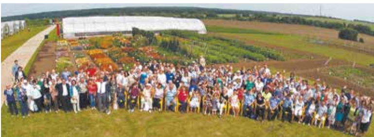
День Поля «СеДеК» 2015. Ежегодно Дни Поля собирают около 200 представителей аграрного сектора из всех регионов России

А вот где! По 10 коп. можно было купить стандартные томаты типа: Белый налив, Талалихин, Волгоградский 5-95 . Если эти томаты вырастить на своем участке, взять из них семена и встать с ними на рынке, будешь работать себе в убыток. Этот товар немногие будут брать, ведь его можно купить деше-