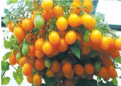
Сладкая гроздь золотая. Несколько увесистых «гроздей» томатов на каждом растении

Любой сладкоежка придет в восторг от новых «конфетных» сортов Сладкая гроздь золотая и Сладкая гроздь шоколадная . Эти раннеспелые сорта (созревают через 90–100 дней после полных всходов), предназначенные для вы-